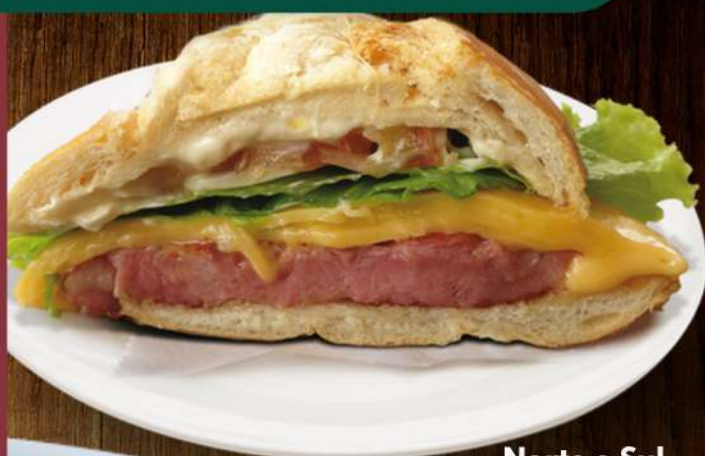
Norte e Sul